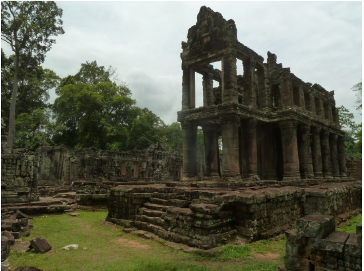
Un morceau de Preah Kahn