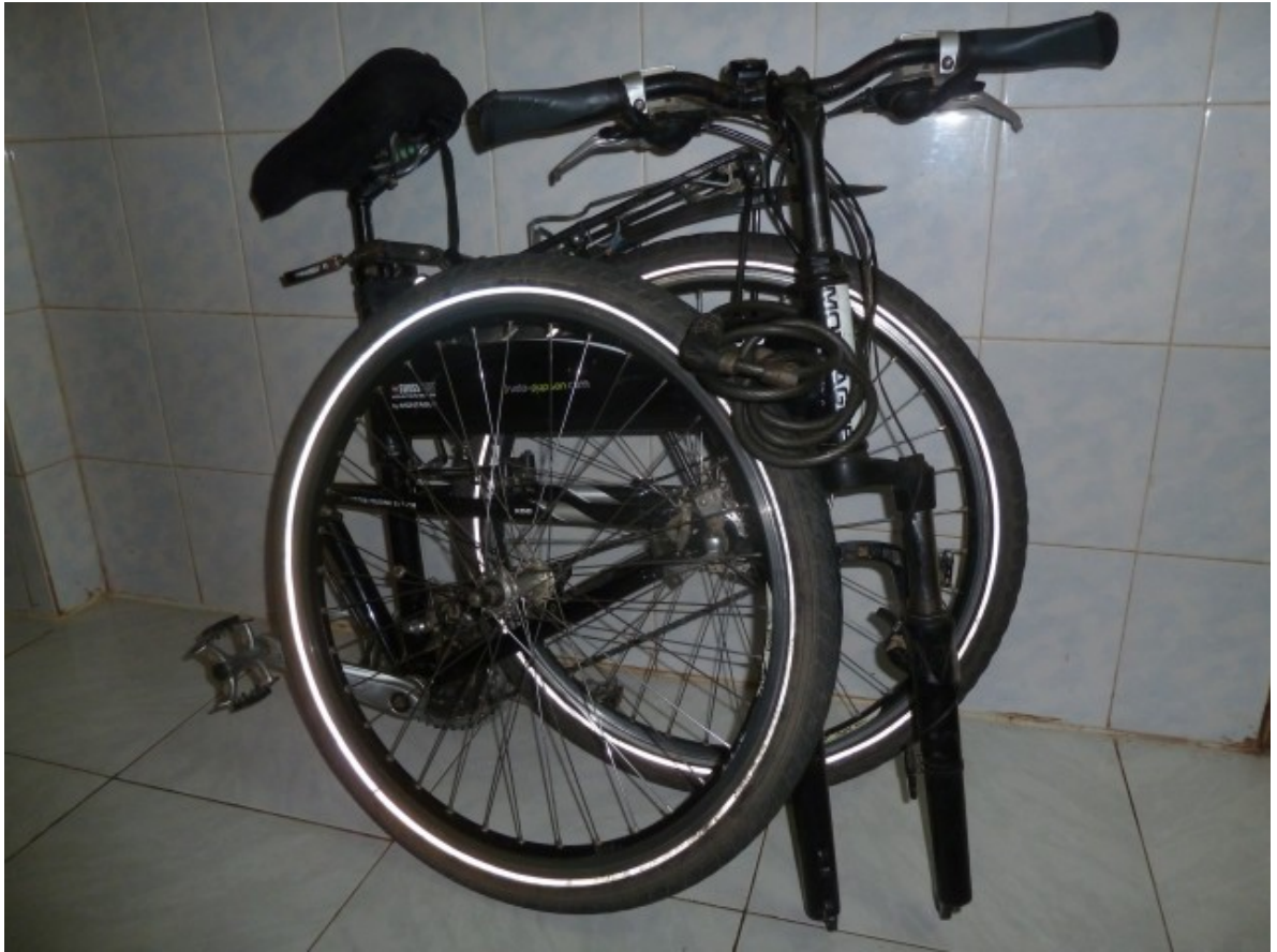
Un vélo en berne

Le 18, je ne ressens plus de douleurs dans les genoux en marchant, je tente donc une sortie vers Angkor. Comme il paraît que camper est dangereux, je commence à me chercher un petit coin de forêt à l'abri des flics et autres malfaisants quand un chauffeur de tuk-tuk voyant mon entêtement à dormir dans la forêt, me rappelle (il m'avait conseillé de retourner en ville dans une auberge), et m'invite à passer la nuit chez lui, avec tout le reste de la famille. Une dizaine de personnes, une moyenne d'âge de 15 ans environ. Une jeune fille que je prends pour sa soeur de 13 ans commence à donner le sein au gamin de 9 mois. Euh... quel âge a ta femme? « 18 ans, c'est jeune hein? » Ouais c'est jeune mais bon ça va... je suis quand même rassuré.