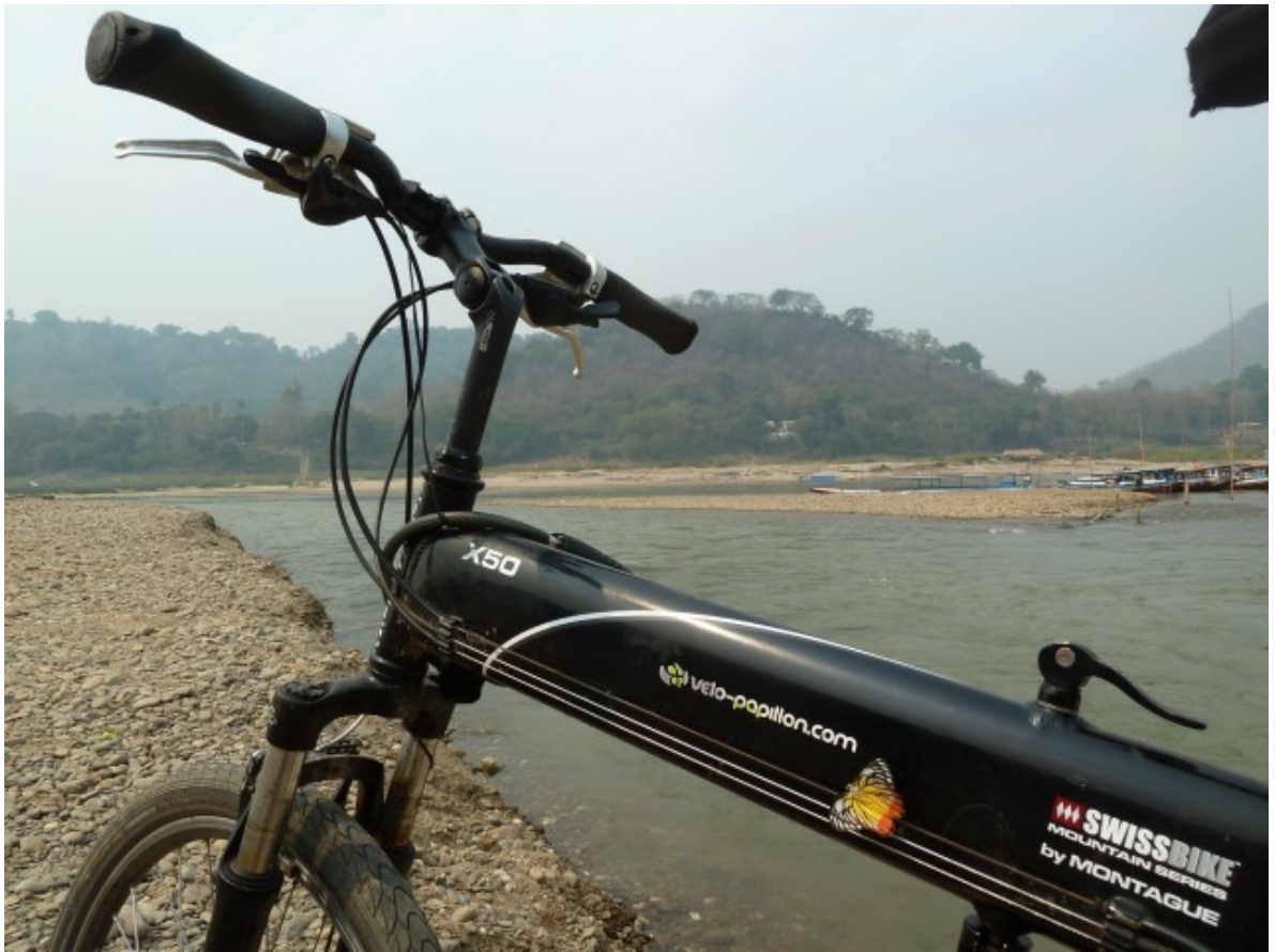
Une spéciale pour notre sponsor Vélo-papillon